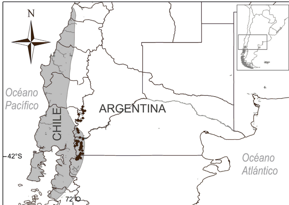
FIG. 1. Distribución geográfica del Churrín Grande ( Eugralla paradoxa ) con énfasis en los registros en Argentina (rombos) según los datos en el Apéndice. Distribución general (sombreado gris) basada en Ridgely et al. (2007).

dades dentro del Parque Nacional Lago Puelo: Campamento de Educación Física (CEF), Pampa de Fernández, Arroyo Aguja y Cerro Cuevas; esta última localidad cerca del límite superior altitudinal de la especie. Los faldeos del cerro Cuevas constituyen el sitio con mayor superficie de distribución continua de la especie.